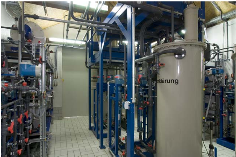
Abbildung 2: Membranklaranlage